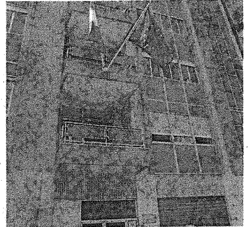
GEOMETRI La sede del collegio

«Puntiamo a perfezionare i servizi e l'offerta formativa»